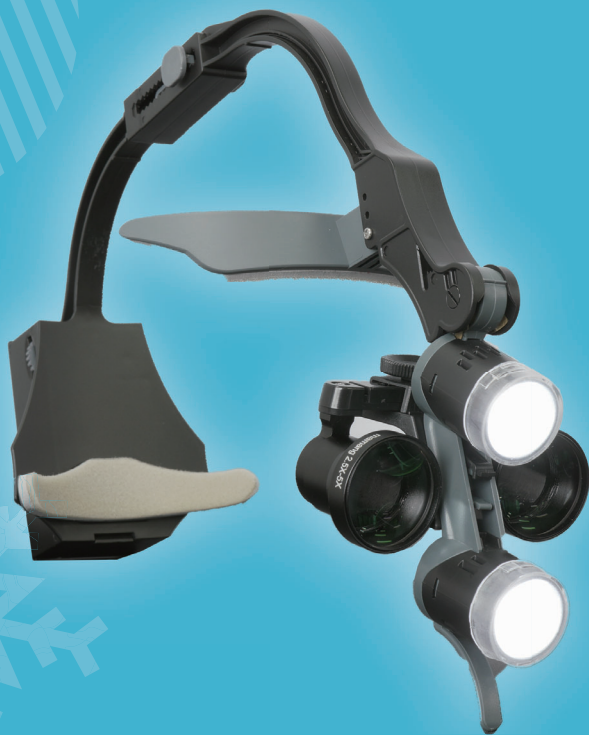
歯科用ルーペ シャドーレスルーペII