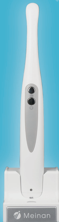
ワイヤレス口腔内カメラ パットカムプレミアム