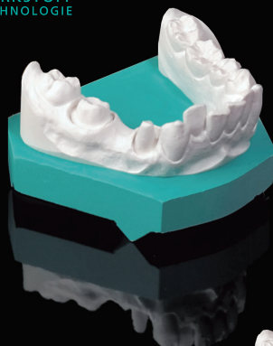
ターコイズブルー