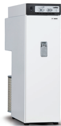
Z1 ECO PRO