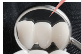
通常加工のミラー