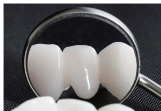
フロントサーフェスマirror

鏡面仕上げのため、ゴーストが発生せずに歯牙をくっきりとシャープな像で視認できます。