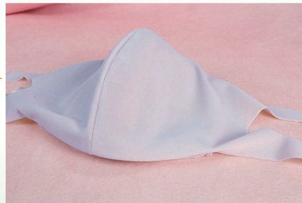
洗濯ネットでも洗えます。