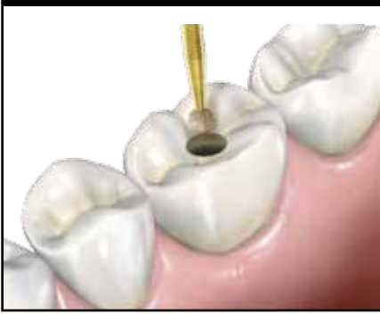
エンド治療のアクセスに