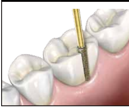
ジルコニアクラウンの撤去に